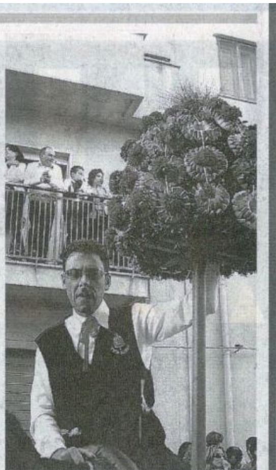
Festa di Tagliavia

*** Sino al 4 luglio la Festa di Tagliavia a Vita si potrà ammirare nelle miniature realizzate da Gaetano Marsala ed esposte nei locali sul corso Garibaldi, 136 del piccolo paese. Si tratta di piccoli capolavori che il signor Gaetano ha realizzato col fratello Filippo, coltivando così un'antica passione artistica. Sono perfettamente riprodotti momenti della festa dedicata alla Madonna: dalla processione del quadro, ai carri trainati dai buoi. Informazioni: 338 / 3482125. (*MAX*)